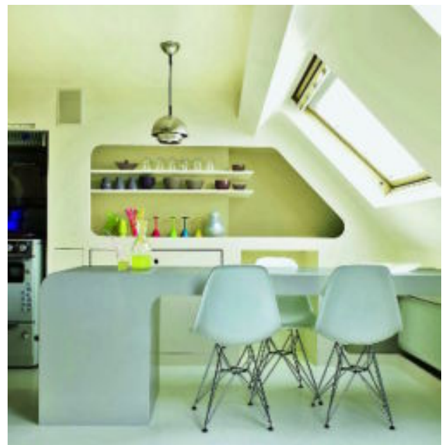
RETROFUTURO EN MARFIL. Cocina pintada con la pintura Alaska de la firma Bruguer.