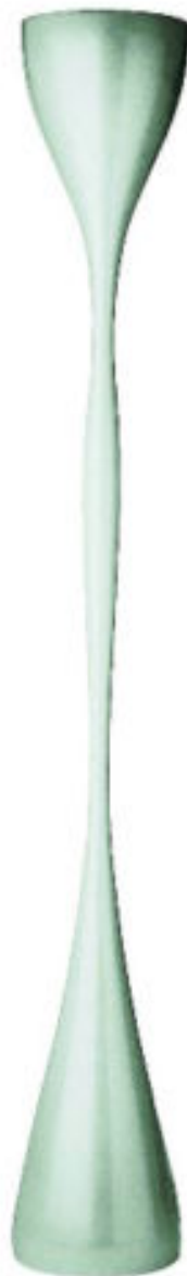
CADENCIA MUSICAL. Lámpara Jazz lacada diseñada por Diego Fortunato para Vibia. Su forma permite rebotar la luz al techo. De venta en Años Luz.