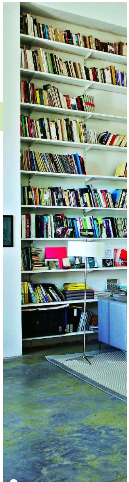
POCA INVERSIÓN. El color y los textiles son dos de los agentes que producen los cambios más importantes en decoración, y ninguno de ellos requiere de un desembolso exagerado.