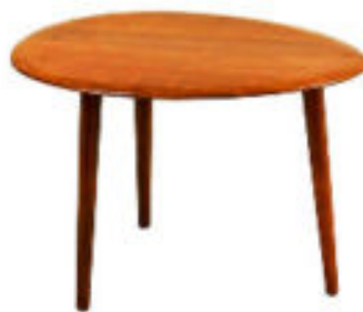
CONQUISTAR ESPACIO. Mesa auxiliar de madera. Se trata del modelo Float de Zara Home.

¿Cuánto tiempo hace que el sofá está así y en ese lugar? Si la respuesta es "mucho" o "no recuerdo", se comprende el aburrimiento. Para darle otro aire al espacio no es necesario gastar mucho. Bastará pintar una pared, las puertas o unos muebles. Como por arte de magia todo lo que ya estaba en el cuarto encajará de otra forma. El punto de partida ya está allí. A veces es un cuadro, una tela o una alfombra. Utilícelo como hilo conductor. Si tiene la suerte de tener un sofá en tonos neutros –blanco, beis, gris, negro, piedra– es más fácil. Busque un tono y poténcielo con detalles. Un ejemplo: ya hay un sofá gris y una alfombra con rojo oscuro. escoja un par de cojines con dos estampados distintos en esos matices y ponga un tercer cojín en naranja. De este modo hay armonía, pero también vida. O reúna en una pared fotos, dibujos, un cartel. Observe bien qué color prevalece y pinte la pared en ese tono.