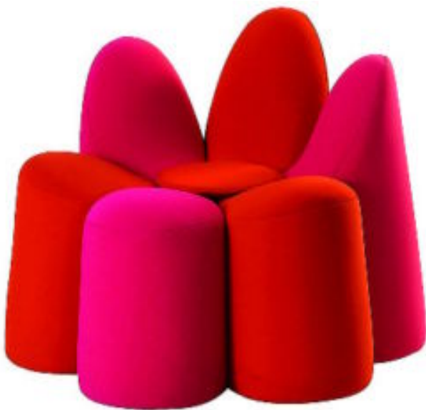
DESPIERTE UNA SONRISA. Butaca Mayflower de Roche-Bois. Se comercializa en distintas combinaciones de colores.