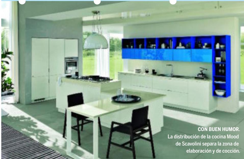
CON BUEN HUMOR. La distribución de la cocina Mood de Scavolini separa la zona de elaboración y de cocción.

Si para buscar la espumadera se tropieza con la fregona o no es posible ejecutar la secuencia almacenaje-lavado-elaboración de la comida sin chocarse con algo, es necesario re- pensar el espacio. Lo más probable es que tenga un problema de distribución del espacio. Para resolverlo hay que recapacitar sobre los pasos que se suelen dar en la cocina. Cuanto más a mano estén los útiles imprescindibles, menos lío. Los elementos de limpieza se pueden guardar aparte, y otros electrodomésticos como el microondas no necesitan estar junto a los transitados cien centímetros del conflicto diario. Un buen ejemplo lo proporciona la distribución de la cocina que aparece en la fotografía de la izquierda. Prescinda del lujo de espacio que tiene e imagine el resultado en una estancia rectangular típica: una nota de color, dos áreas de trabajo; el almacenaje al fondo y la posibilidad de comer si se prolonga la encimera de la zona de cocción.