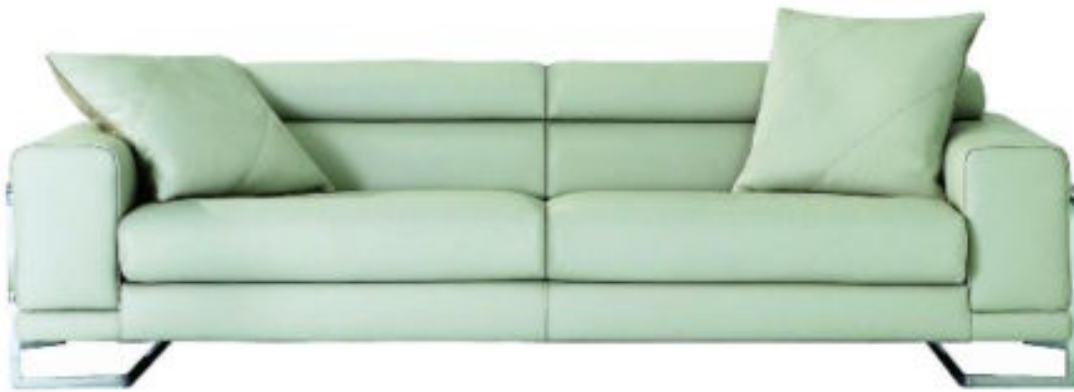
EXTRALARGO. Lineal y claro para iluminar: sofá Theorem en edición especial de piel de la firma Roche-Bobois.