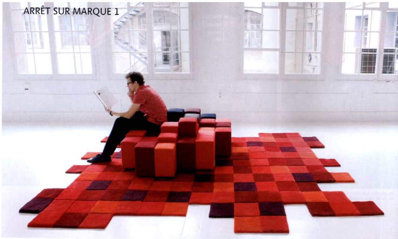
Do-Lo-Rez, sofa (Moroso) et tapis (Nanimarquina), comme des pixels tout droit sortis de l'imagination de Ron Arad.