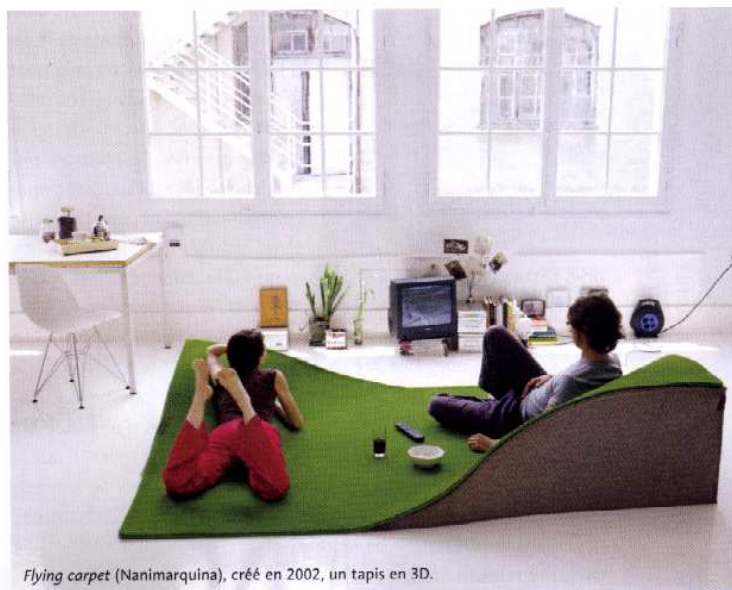
Flying carpet (Nanimarquina), créé en 2002, un tapis en 3D.