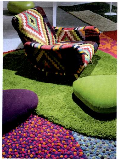
De gauche à droite : tapis ronds Rangoli , d'inspiration mandala ; modèle rectangulaire African House . Photo de droite, de bas en haut : Tapis Topissimo en deux coloris et Zoom vert, coussins Zoom Cojin vert et violet, tapis Juliette et fauteuil Lady Chair de Marco Zanuso.