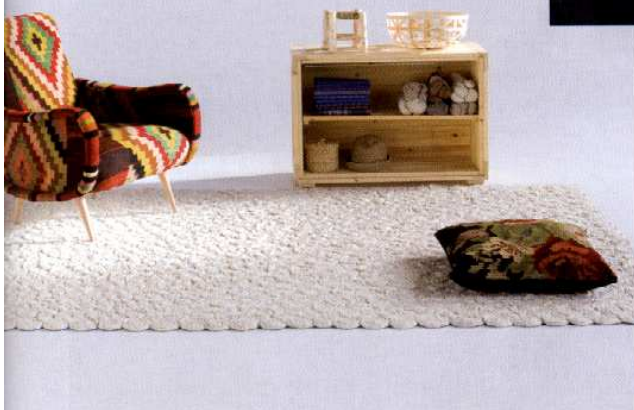
Tapis Spiral (Nanimarquina).