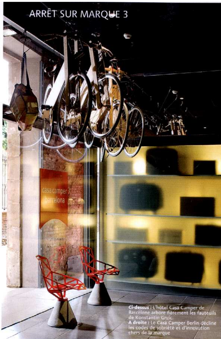
Ci-dessus : L'hôtel Casa Camper de Barcelone arbore fièrement les fauteuils de Konstantin Grcic. A droite : Le Casa Camper Berlin décline les codes de sobriété et d'innovation chers de la marque

rone), Alfredo Häberli (Paris, Londres), Jaime Hayón (Londres, Tokyo, Paris, Barcelone, Majorque, Milan). Signée de l'architecte Juli Capella, la dernière boutique Camper Together vient d'ouvrir à Madrid. Avec une cafetière italienne king size trônant dans la vitrine aux côtés de la formule « Exposicion y venta di zapatos – exposition et vente de chaussures », Camper rend hommage aux icônes du design, qui se révèlent généralement les objets les plus quotidiens. Un portrait chinois de la marque en quelque sorte ! Design, architecture et convivialité mêlées encore avec la diversification vers le monde de l'hôtellerie, incarnée par la belle aventure Casa Camper. Après Barcelone en 2005, un second hôtel, privilégiant le mode de vie plus que les étoiles (!) vient d'être dévoilé cet automne à Berlin en plein Mitte. Le bâtiment flambant neuf, imaginé par Fernando Amat (Vinçon) et Jordi Tio, abrite également le restaurant de tapas asiatiques Dos Pallilos , conçu par Erwan et Ronan Bouroullec, et dirigé (tout simplement !) par Albert Raurich, ex-chef de cuisine de Ferran Adria. Une philosophie 100 % Camper du luxe contemporain basé sur la simplicité, la discrétion, l'authenticité et un style plus sain. « Plus qu'une marque, Camper est une manière de vivre », résume Lorenzo Fluxà. #