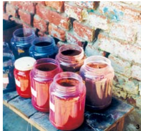
1 베를을 이용해 양탄자를 만드는 장인의 모습. 상당히 분업화된 모습이다. 2, 3 장인들이 사용하는 도구. 4 인도에 나니마르키나가 세운 학교에서 아이들과 함께한 나니 마르키나. 5 양탄자는 사람의 피부에 바로 닿는 직물이기에 질감이 중요하다. 이 질감을 일일이 손으로 매만지는 인도의 장인.