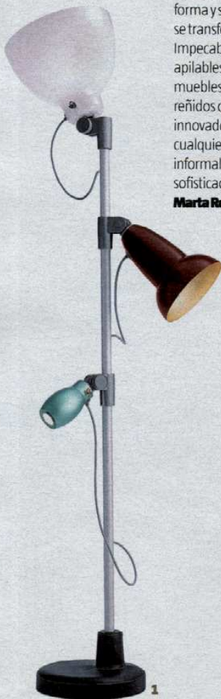
1. Tres en uno Lámpara Blossom. De Hella Jonguerius. Pantallas opal y aluminio. Mástil de aluminio. Pie de terracota, cuero o sintético. Belux