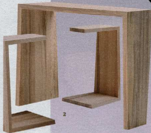
De abedul y fresno. Creadesign 3. Flexible Lámpara Alizz C. Cooper. Tubo de goma que asegura la posición de la pantalla. Gira 360°. Ingo Maurer 4. Extensible Mesa y banco